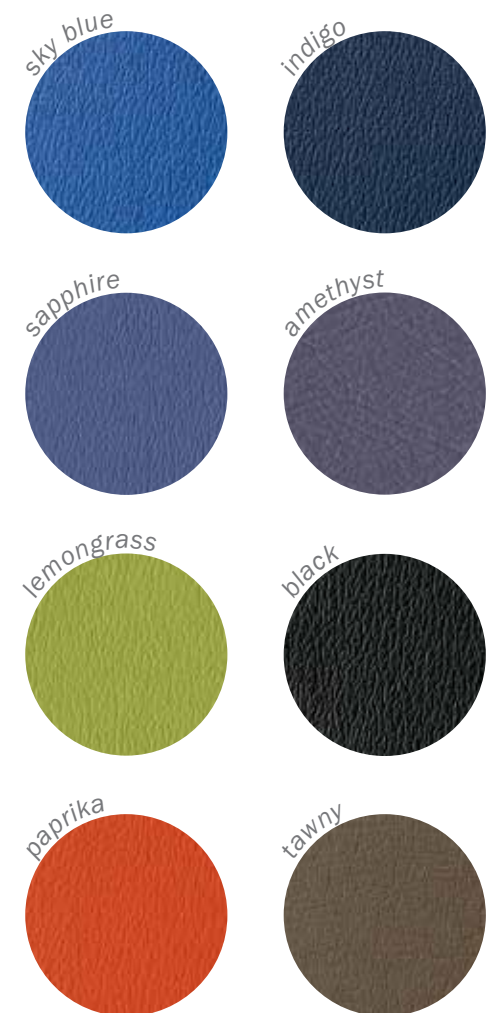
Consulte al distribuidor de A-dec autorizado para obtener muestras en color precisas y la información del producto más actualizada.