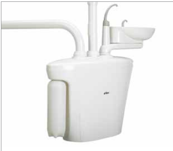
Botella de agua autónoma.

La escupidera de porcelana gira hasta encontrar la posición correcta del paciente. La botella de agua de dos litros se llena con facilidad y proporciona un suministro de agua continuo durante múltiples procedimientos. El centro de soporte ofrece un amplio espacio de almacenamiento para agregar accesorios como separadores de amalgama y sistemas de succión.