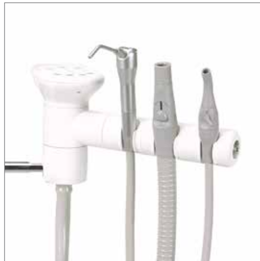
Se muestra el soporte único de tres posiciones con panel táctil y jeringa opcionales.

Coloque los instrumentos de succión para tener un acceso cómodo al paciente con el soporte de tres posiciones y el brazo telescópico.