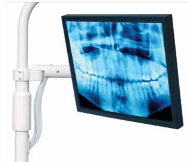
Montaje del monitor.

El montaje del monitor se posiciona fácilmente sobre el paciente para la consulta y educación conveniente del paciente.